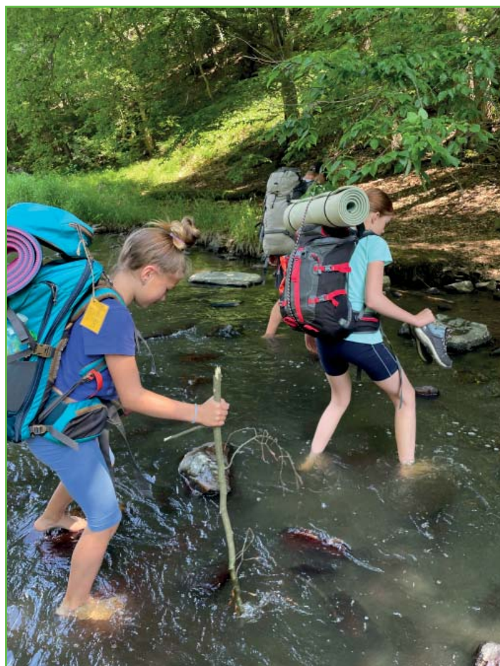
Brodění přes řeku Oslavu

V neděli ráno jsme přebrodili řeku Oslavu a pokračovali po pravém břehu po červené směrem k Náměšti. Do cesty se nám postavilo několik skal, které poutníci musí překonat pomocí natažených řetězů. Vše jsme zvládli a v místech, kde se stezka zvedá ven z údolímí, jsme naposledy v údolímí vydatně posvačili. Nad údolímí jsme již spatřili Náměšť a každým krokem jsme byli blíže k cíli našeho putování. Na místním nádraží jsme naskočili na rychlík a naše dobrodružství se chýlilo ke konci. Domů jsme dorazili unavení, ale plní nových zážitků a zkušeností z pobytu v krásné přírodě okolí Chvojnice a Oslavky.