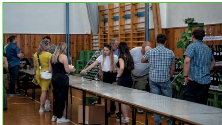
Výstava vín místních vinařů