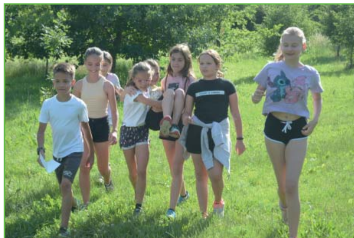
Hry na závěrečné celooddílové schůzce