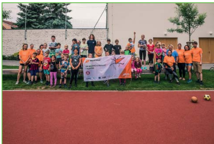
Účastníci celoevropské akce MoveWEEK