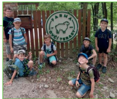
Bobři u farmy Ovčí terasy

hlédli po okolní krajině. Jakmile jsme se posilnili, pokračovali jsme směrem na farmu Ovčí terasy. Když jsme dorazili na místo, šli jsme se podívat na místní zvířátka. Viděli jsme například ovce, prasátka, kachny nebo králíky. Po tomto zážitku jsme si ale museli pospíšet nazpět, abychom se stihli vrátit domů.