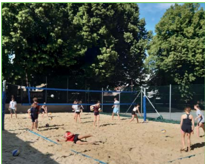
Beachvolejbal v Rajhradě

dny pro mládež a jeden pro dospělé. Mládežníci trénují v pondělí (16:00–17:30), středu (15:30–17:00) a pátek (16:00–17:30), dospělí přebírají kurt po dětech v pátky (od 17:30). I navzdory nutnosti dojíždět do Rajhradu je účast mládeže na písku stále velmi hojná a to nás moc těší. Šestkový vo-