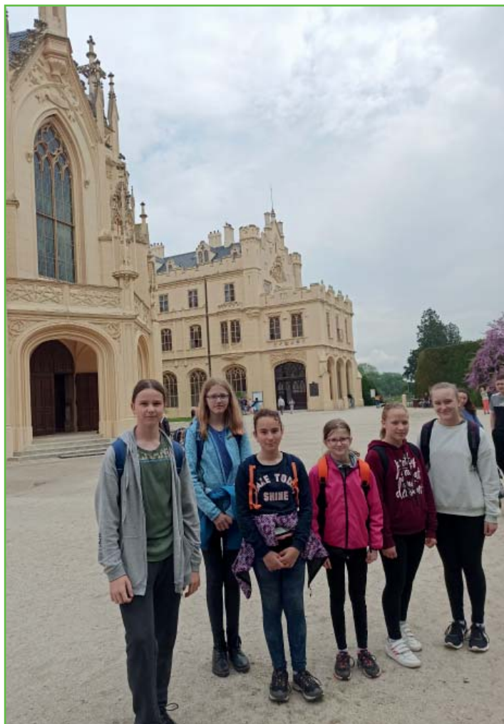
Ještěrky v Lednicko-valtickém areálu

Cesta ubíhala svižně, vedla převážně po cyklostezkách a byla protkána mnoha drobnými stavbami, kterými je Lednicko-valtický areál typický. Po chrámu Tří grácií tak následoval Apollonův chrám a následně už perla areálu zapsaného na seznam světového kulturního dědictví UNESCO – zámek Lednice. Na zámku jsme si prošli část přilehlých zahrad a pokračovali směrem na umělou zříceninu Janův hrad. Nebyly to však jen stavby, které jsme cestou obdivovali. Zdejší lužní lesy jsou pastvou nejen pro oči, ale taktéž pro vzácné živočichy a rostliny. Z Janohradu jsme zanedlouho dorazili do cílové stanice v Ladné, kde jsme nastoupili na vlak směrem do Hrušovan a náš vydařený výlet ukončili.