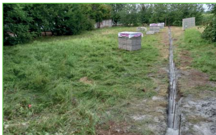
Rozšíření zahrady v MŠ na Sídlišti