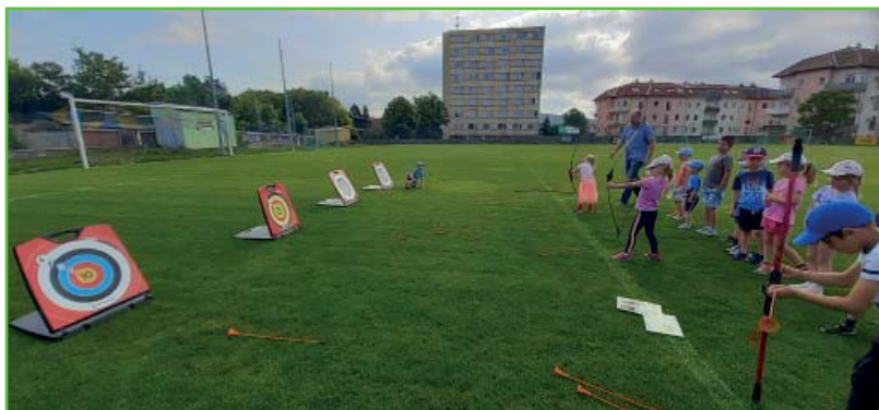
Dětský den na fotbalovém hřišti