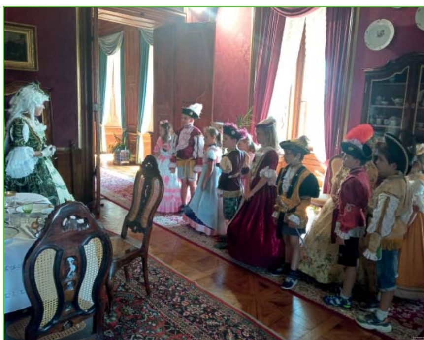
Třída 1. B na zámku Milotice

Přejeme všem krásné prožití letních prázdnin plných radosti, odpočinku, štěstí, cestování a objevování nových dobrodružství.