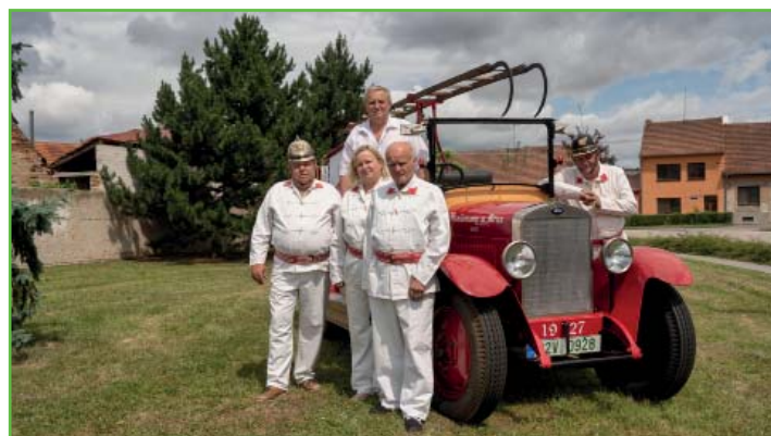
Den otevřených dveří v hasičské zbrojnici