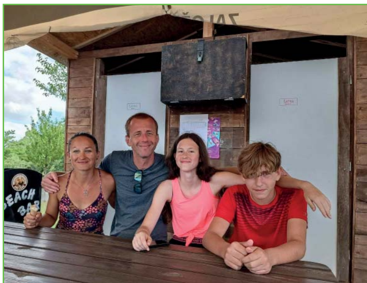
Reprezentace jednoty na smíšeném turnaji v beachvolejbalu za účasti mládeže