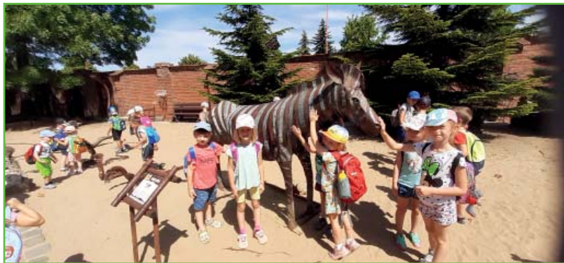
Výlet do KOVO ZOO

Krásné léto, dětem hodně sluníčka i odpočinku a v září na shledanou!