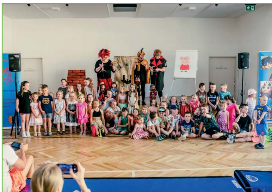
Divadelní představení O čertici Gvendolíně

Představení byl náš první pokus přivést do Hrušovan divadelní kulturu a hodnotíme to velmi pozitivně. S Pronitkou rádi zůstaneme v kontaktu a věříme, že v Hrušovanech nabytá naposledy.