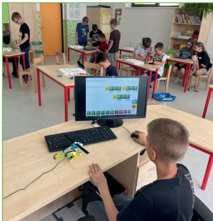
Projektový den v 5. B