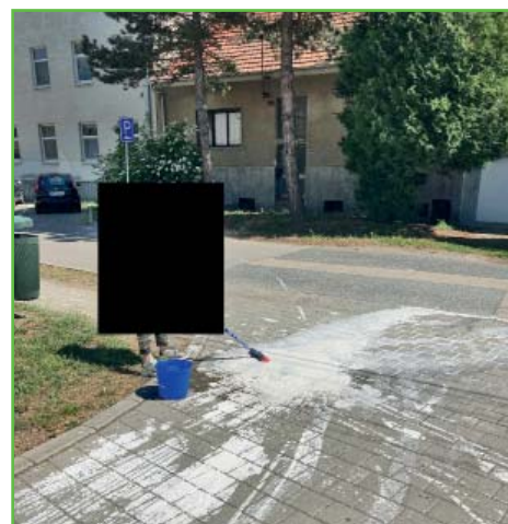
Ukázka fungování kamerového systému na facebooku Obecní policie Hrušovany u Brna

Obecní policie oznamuje, že dne 16. 5. 2022 byl zřízen facebook Obecní policie Hrušovany u Brna.