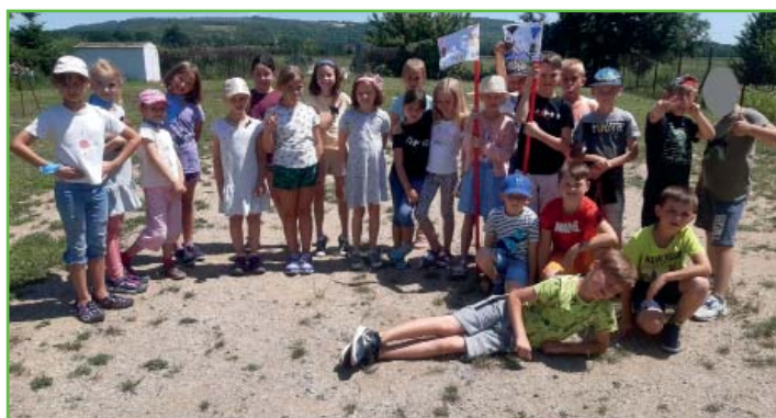
Týden na opuštěném ostrově

Během týdne na opuštěném ostrově jsme absolvovali mnoho různých soubojů a zápasili s tropickým vedrem. Závěrečná ostrovní odměna ale nakonec vykompenzovala všechny naše útrapy a na celé naše dobrodružství na vlnách fantazie budeme určitě dlouho vzpomínat.