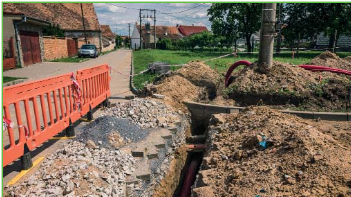
Položení elektrických kabelů na ulici Stávání