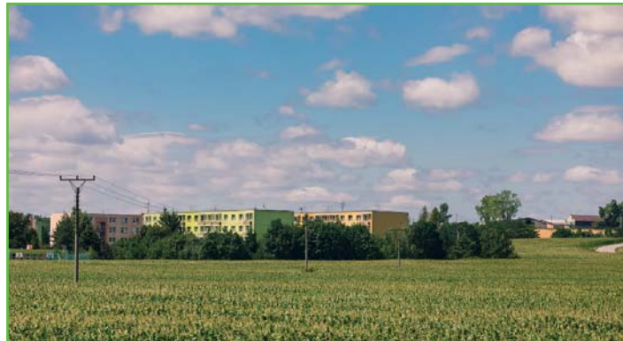
Sídliště a obchvat – červenec 2022