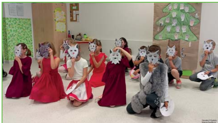
Operetka O Karkulce

Operetkou jsme potěšili nejen naše nejbližší, ale i žáky 1. a 2. tříd.