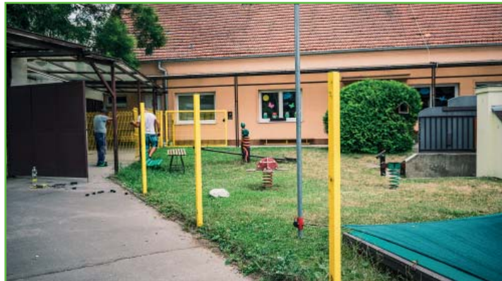
Demolice starého plotu v MŠ na Havlíčkové ulici