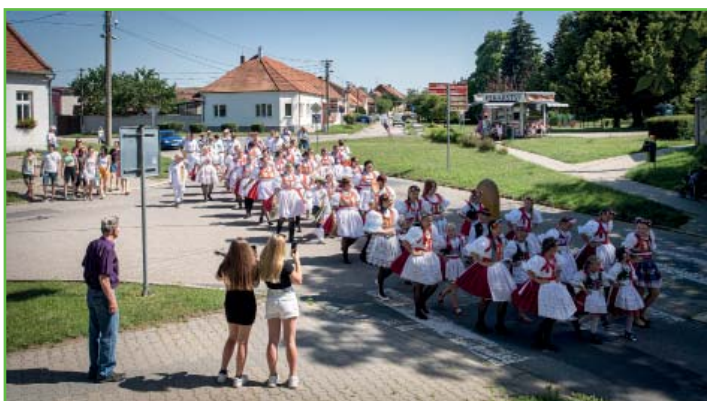
Babské hody