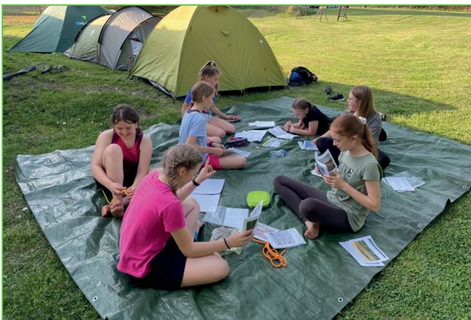
Poslední osvěžení znalostí před závody zálesácké zdatnosti