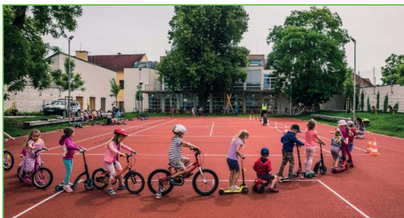
Děti trénují pravidla silničního provozu