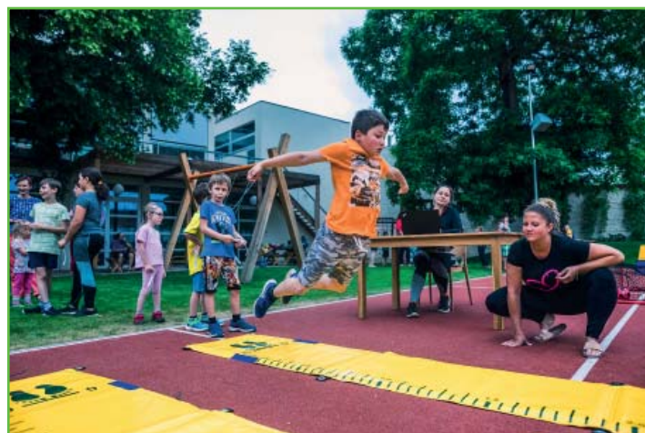
MoveWEEK – skok do dálky