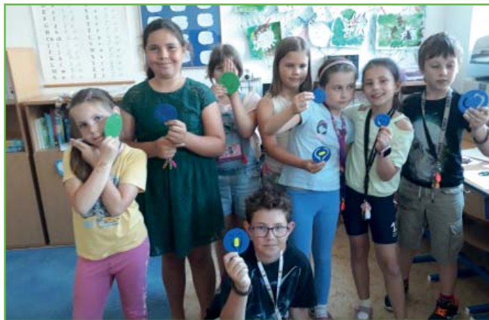
3D exkurze ve školní družině

Dne 8. 6. bylo oddělení naší školní družiny pozváno na exkurzi do kroužku 3D tisku. Příjemné odpoledne jsme strávili v rajhradské škole pod vedením Ing. Pavely a jeho žáků. Nejprve jsme se dozvěděli zajímavé informace o 3D tisku, např. jak tiskárna funguje, jaké trojrozměrné modely se dají vytvořit. Následně si naši žáci za pomoci tamních žáků mohli navrhnout a vytisknout vlastní šablonu na zdobení kakaa nebo kávy. Jelikož byli moc šikovní, vyzkoušeli si také navrhnout svoji vlastní jmenovku. Exkurze byla velmi zajímavá. Měli jsme možnost odhalit tajemství 3D tisku. Děti měly největší radost z vytvoření vlastního výrobku.