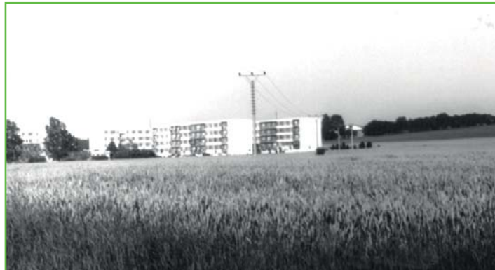
Pohled na Sídliště v roce 2001

Srovnajte si na fotografiích, jak vypadaly Hrušovany dříve a nyní: stejné místo, jiná doba. Pokud máte ke zveřejněným fotografiím jakékoli doplňující informace, komentář nebo pokud máte staré fotografie, o které byste byli ochotni se podělit, kontaktujte kronikářky na e-mailu kronika@ouhrušovany.cz nebo na telefonním čísle 725 772 774.