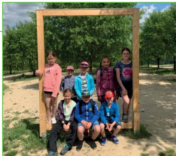
Vlčata v Mandloňové stezce

V neděli dne 22. 5. proběhl jednodenní turistický výlet družiny Vlčata. Cíl byl jasný – poznat krásy hustopečských mandloňových sadů pomocí naučné stezky vedoucí mezi alejemi. Celá družina se v ranních hodinách sešla před klubovnou, od které se přesunula na vlakové nádraží. Vlakem jsme se dostali do Hustopečí, kde byl cíl jasný. Vyšplhat se skrze sady na vrchol, kde na nás čekala rozhledna. Počasí nám přálo, slunce hřálo a stín nám dělaly mandloně. Cesta byla příjemná, nebyla náročná, takže jsme se k rozhledně dostali jedna báseň a mohli jsme se přiučit nové věci o mandloních díky naučným cedulím. Na vrcholu jsme viděli sady z výšky i celé okolí Hustopečí. Využili jsme času na zasloužený odpočinek a na hry. Výlet zde neskončil, ještě nás čekala cesta zpět. Po úspěšném slezení z vyhlídky jsme si dali zaslouženou zmrzlinu a utíkali na vlak zpět.