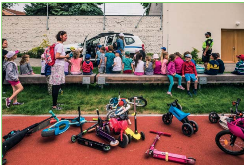
Dopravní výchova s obecní policií