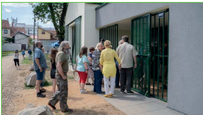
Slavnostní otevření rybářské chaty