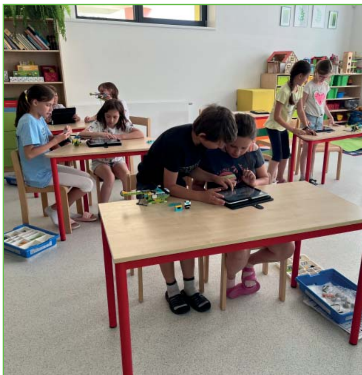
Projektový den v 5. A

Jednou chtěla jít na čarodějnickou noc do borůvkového údolíčka. Tajně tam přiletěla na koštěti a vmáčkla se mezi ostatní čarodějnice. Tancovala tam u ohně čarodějnický tanec jménem čaroděj. Asi cca po dvaceti minutách ji tam objevila čarodějnice Marta, která byla velmi zlá a podlá. Řekla vrch-