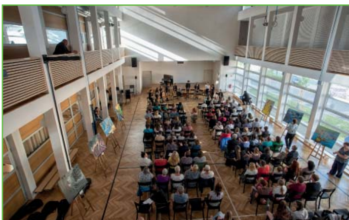
Koncert ZUŠ Židlochovice pro Hrušovany