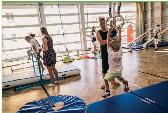
Sokolský den – cvičení uvnitř