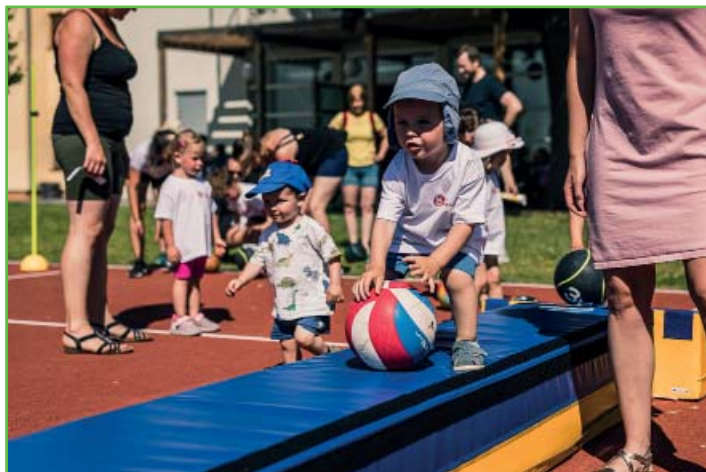
Sokolský den – venkovní disciplíny