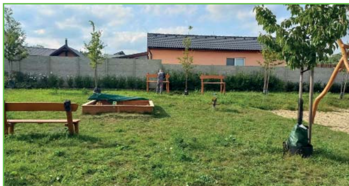
Instalace nových laviček na hřišti Pod Střediskem