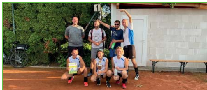
Vítězný tým antukového turnaje v Rajhradě