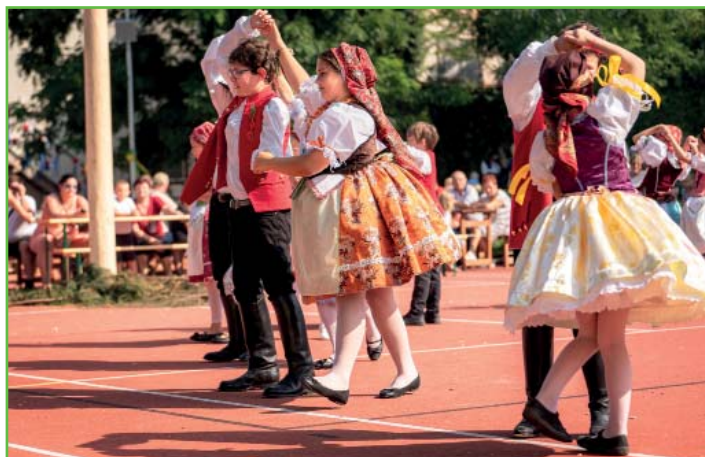
Nedělní vystoupení dětí během hodové zábavy

Velký dík patří i všem dobrovolníkům, kteří zdarma pomáhali s organizací, při úklidu či u vstupů v pokladnách.