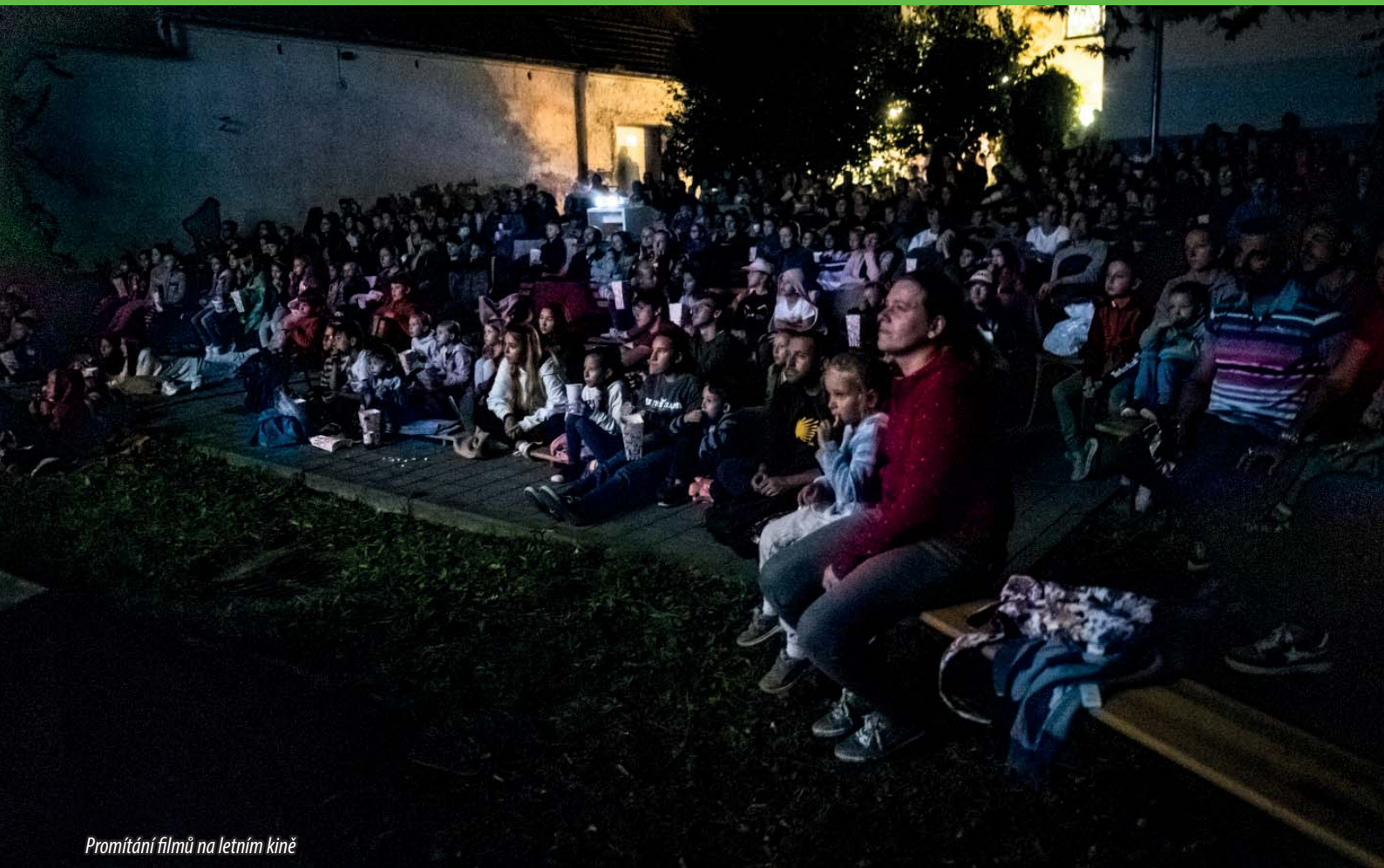
Promítání filmů na letním kině