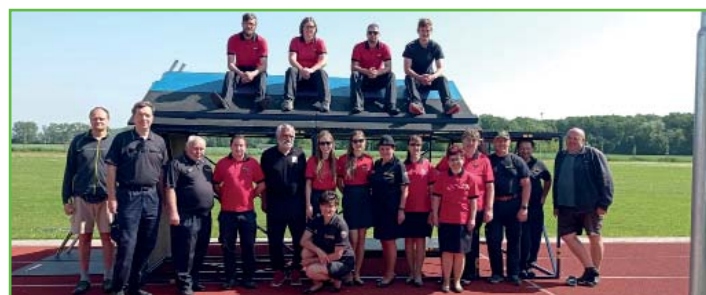
Rozhodčí na zimním halovém kvartetu