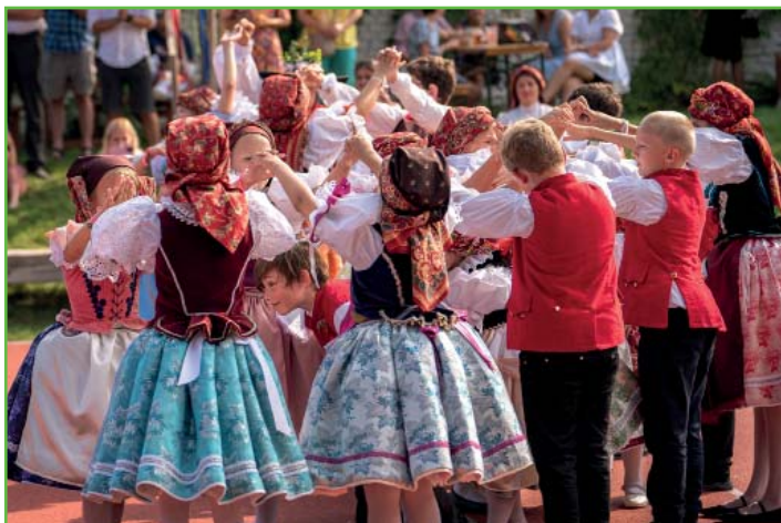
Vystoupení dětí folklorního příměstského tábora