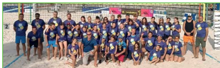
Účastníci beachvolejbalového turnaje v Modřicích