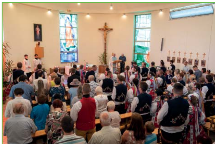
Hodová mše