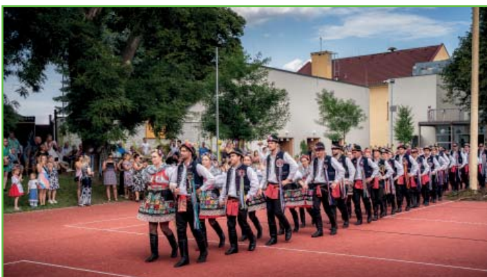
Průvod stárků na dvoře Sokecu