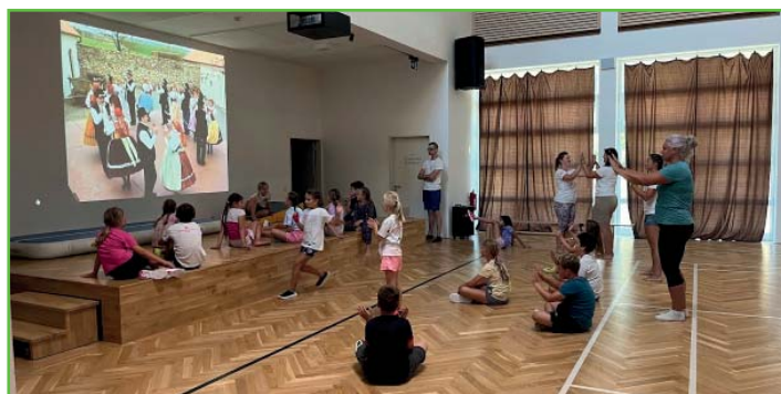
Folklorní příměstský tábor

Dle ohlasů návštěvníků hodů, rodičů i samotných dětí jsme přesvědčení, že se vše vydařilo přesně tak, jak mělo. Budeme se těšit na příští rok.