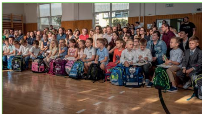
První školní den na ZŠ