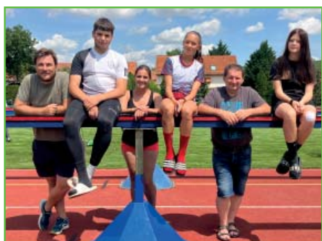
Dorost ve Výrovicích

Vedoucí mládeže se poslední srpnový den na setkání vedoucích a rozhodčích ve Tvarožné podrobně seznámili s novými pravidly – získané poznatky se budou snažit předat na soustředění mládeže ve sportovním areálu ve dnech 15.–17. 9., kde se budeme připravovat na zahájení nového ročníku Okresní ligy mládeže a závodu hasičské všestrannosti a brannosti, které se uskuteční 7. 10. v Mokrém.