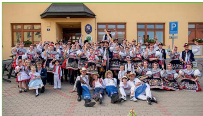
Předání hodového práva před obecním úřadem