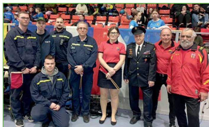
Rozhodčí na mistrovství štafet

Všem přejeme hodně úspěchů při rozhodování na dalších soutěžích a doufáme ve skvělou reprezentaci sboru a obce.