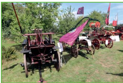
Historická hasičská technika v Radňovsi