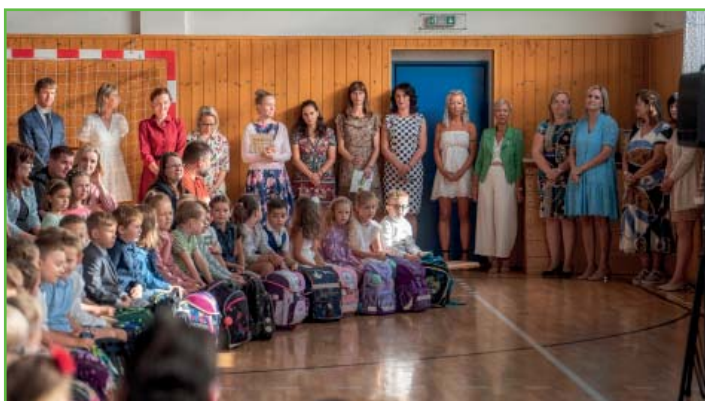
Slavnostní zahájení školního roku na ZŠ