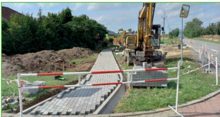
Budování chodníku mezi ulicemi Zahradní a Pod Střediskem