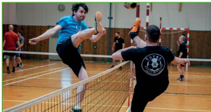
Nohejbalový turnaj na Jízdárenské