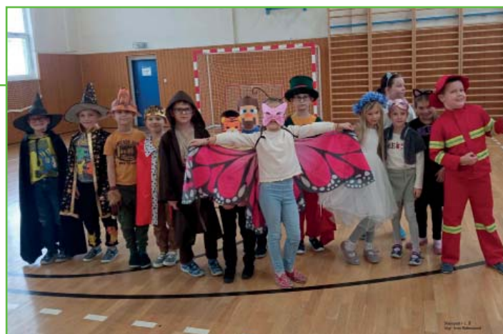
Masopust v 1. B

Masopustní veselí bylo zahájeno v úterý 13. února ráno a provázelo nás celým dnem. První hodinu jsme zahájili rejem masek, ve druhé hodině jsme si vyprávěli o masopustních tradicích a maskách a plnili úkoly přizpůsobené tématu. Ve třetí hodině se všechny první ročníky shromáždily v tělocvičně a začal pravý karneval. Předvedly se nám masky z ostatních tříd a celá hodina byla doprovázena tancem, zpěvem a pohybem. Celý den jsme potom pojídali dobroty, které nám připravily maminky. Následující den jsme vyhodnotili nejkrásnější masky. Odměnu za nápad a tvořivost ale dostali všichni. Den se nám moc vydařil.