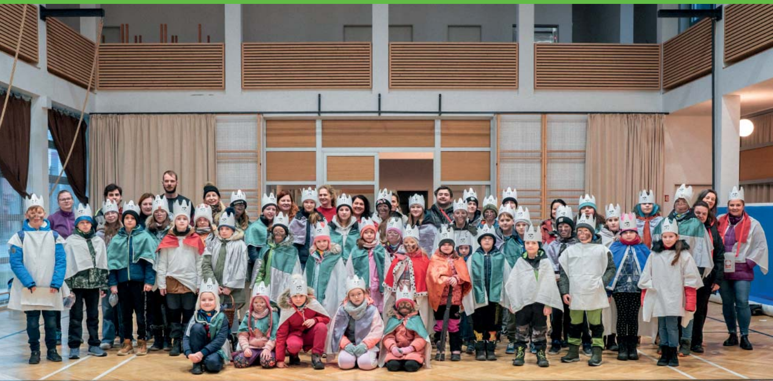
Kolední tříkrálové sbírky