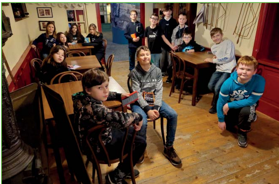
Vysvědčení v Technickém muzeu v Brně – třída 5. A.