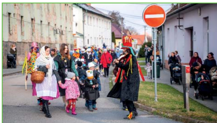
Masopustní průvod obcí