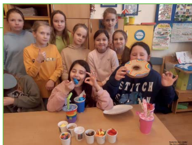
Kuchařská show ve školní družině

či knedla-zela-vepří. A tak se v jídelničkách našich dvou týmů objevovaly takové pokrmy, které na první pohled vzbuzovaly zvědavost. Takže není divu, že naši porotci měli při výběru z jídelniček opravdu těžkou hlavu. Každý porotce nakonec vybral jeden pokrm, dezert či nápoj pro jednu dvojici kuchařů a celá show mohla začít. V našem případě se samozřejmě jednalo o zcela bezpečné