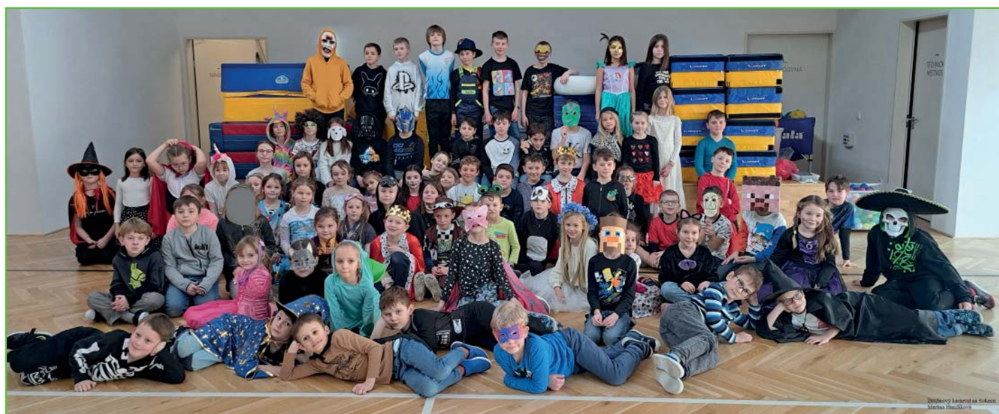
Družinový karneval na Sokecu