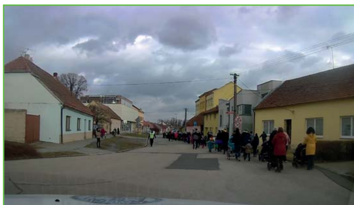
Usměrňování provozu během Masopustního průvodu

Proveden odchyt dvou psů. Majitelé zjištěni na základě zjištění čipů čtečkou.