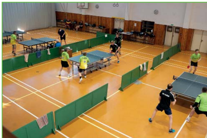
Turnaj ve stolním tenisu