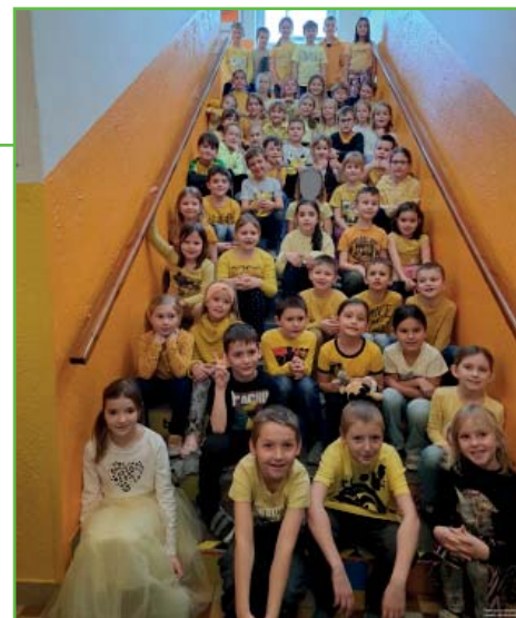
Žlutý den ve školní družině

Teď už se chystáme na jaro. Čekají nás velikonoční dílničky, kde si nazdobíme vejčíka voskovou technikou, která nás moc baví. A také budeme trávit víc času venku na sluníčku, bez navlékání se do bund a rukavic. Na to se moc těšíme.