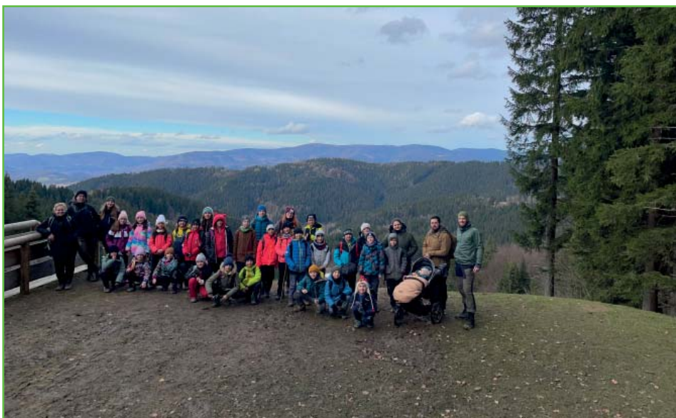
První turnus na Soláni

Pro zpestření programu jsme si na pondělní dopoledne připravili pro děti program v pronajaté sportovní hale základní školy v Horní Bečvě. Po rozcvičce jsme se pustili do týmových her a zápo-