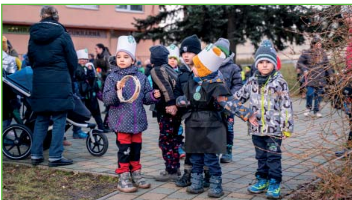
Děti z MŠ se připravují na masopustní průvod