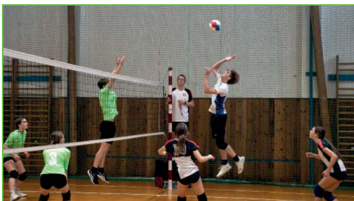
Volejbalový turnaj