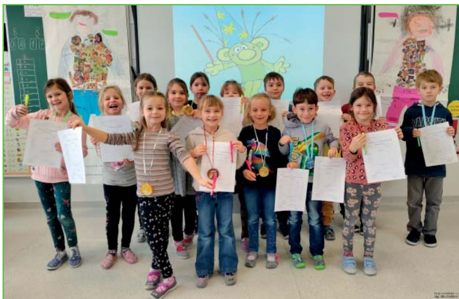
Vysvědčení v 1. A

sopustní období veselí ukončil týden na téma wellbeing neboli dobrobytí s výzvou Mějme rádi sebe i druhé a dělejme pro to maximum, co můžeme. Ať se nám to všem v předvelikonočním období daří, přeji žáci 1. A společně s paní učitelkou a její asistentkou.