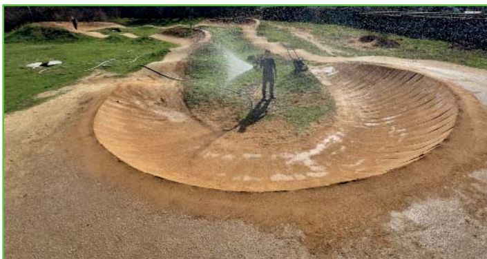
Oprava pumptracku na Jízdárenské