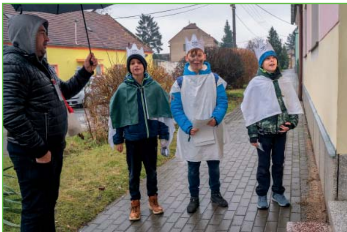
Tři králové