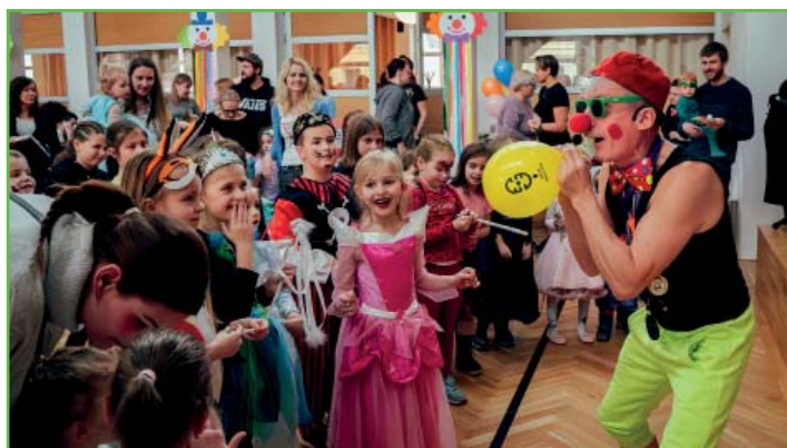
Dětský karneval na Sokecu