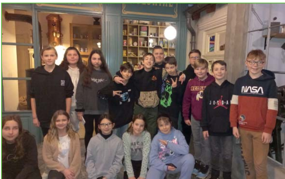
Třída 5. B na vysvědčení v Technickém muzeu v Brně