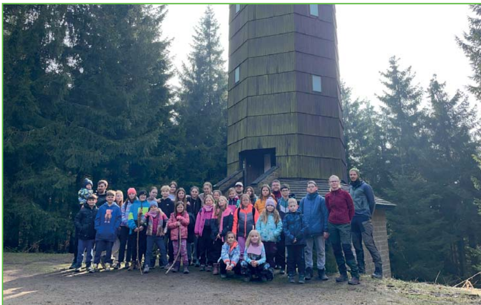
Druhý turnus na rozhledně Súkenická

V sobotu jsme z chaty vyrazili již brzy dopoledne, aby i druhý turnus měl možnost navštívit olomouckou Pevnost poznání. Já osobně jsem strávil na výletě oba turnusy a i při druhé návštěvě expozic během jednoho týdne se dobře bavil. Na závěr bych překřtil letošní zimní výlet na jarní výlet v zimě. Už teď se ale těšíme na další rok na Třeštík a doufáme, že nám to zima vynahradí.