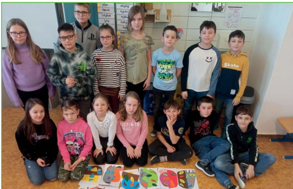
Picasso ve 3. B

Děti nejvíce zaujala právě možnost zahrát si na pro ně nové nástroje. Akci jsme si všichni společně užili.