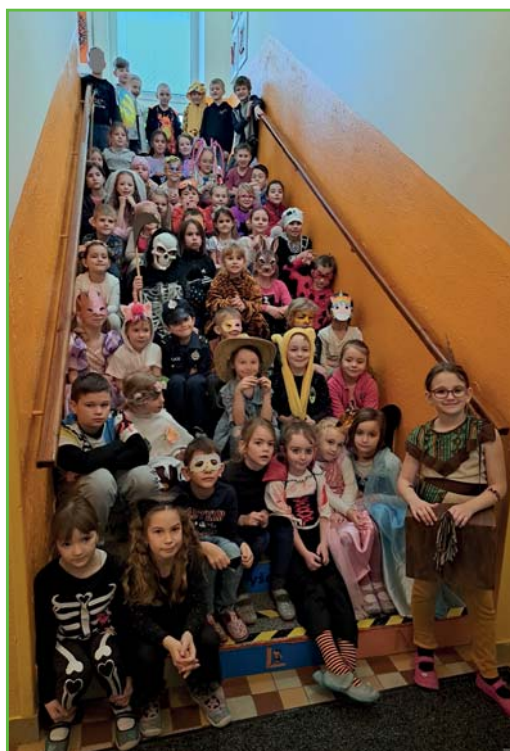
Karneval ve školní družině

Zima už se nám nelíbí, a tak netr-pělivě vyhlížíme jaro, protože pobyt venku je potom přece jenom trochu veselejší. Snad brzy přijde.