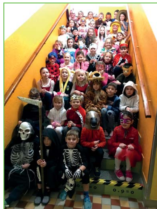
Masopust v prvních třídách