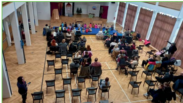
Divadelní představení Tři úkoly pro Marušku (Pavel Kadlec)