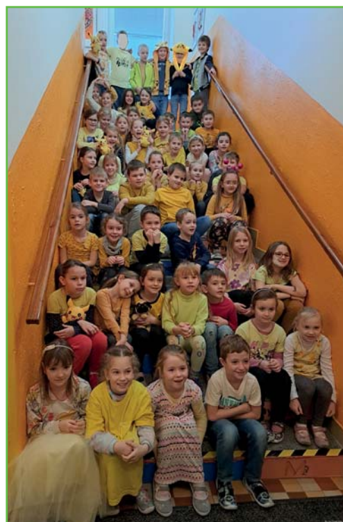
Žlutý den ve školní družině