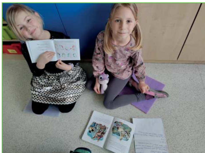
Prezentace knih ve 2. A