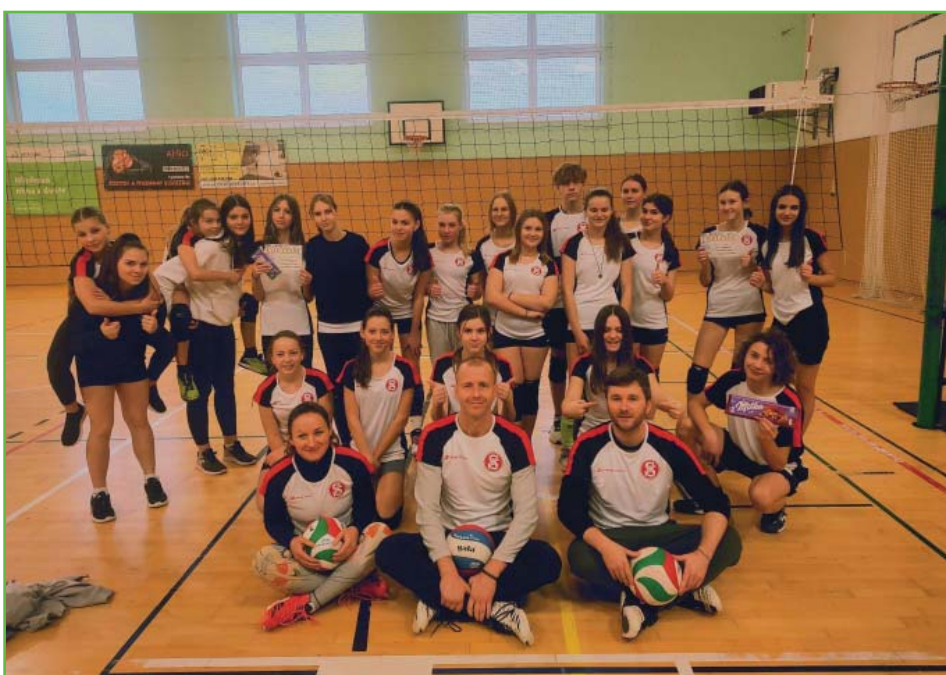
Turnaj ve Střelcích

Kroužek volejbalu pro mládež se stále velmi intenzivně rozvíjí a členská základna se rozrůstá. Děti jsou rozděleny na začátečníky a pokročilé, tréninky se konají dvakrát týdně a trenéři odvádí vynikající práci. V sobotu 28. ledna a 25. února jsme se zúčastnili dalších turnajů „vesnické ligy“, v obou případech ve Střelcích. I přes absenci několika důležitých hráčů se podařilo dát dohromady tři týmy, což je samo o sobě skvělou vizitkou našeho volejbalu.