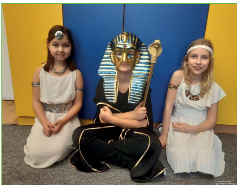
Po stopách faraonů

Po několika dnech jsme opouštěli starověký Egypt plni nových zážitků, dojmů a informací. Podobné výlety na vlnách fantazie proto budou jistě i nadále součástí našeho družinového programu.