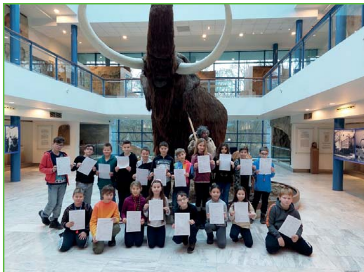
Vysvědčení pod mamutem třídy 4. A

Na závěr naší výpravy jsme obdrželi výpis z vysvědčení přímo pod dohledem mamuta a z pravěku se vydali rovnou do druhého pololetí!