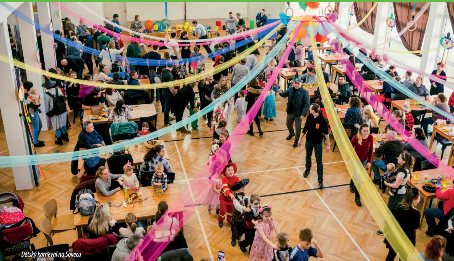
Dětský karneval na Sokecu