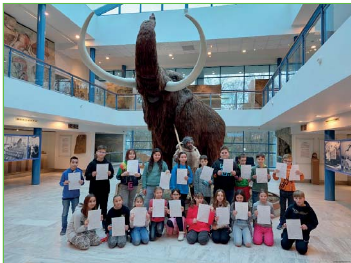
Vysvědčení pod mamutem třídy 4. B