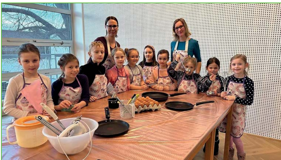
Vaření s malými kuchtíky