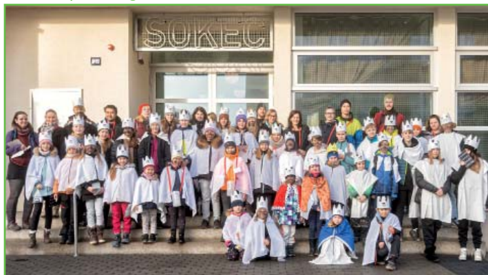
Koledníci Tříkrálové sbírky