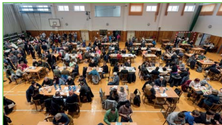
Výstava vín