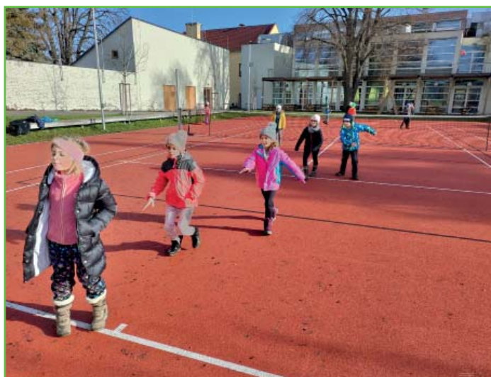
Tělesná výchova ve 2. A

V únoru jsme se zaměřili na rozvoj čtenářských strategií. Učili jsme se klást otázky, psali jsme si vzkazy, hledali zajímavé citace v knihách a říkali si, jak na nás působí. Hodnotili jsme různé druhy dětských časopisů a četli a četli a četli.