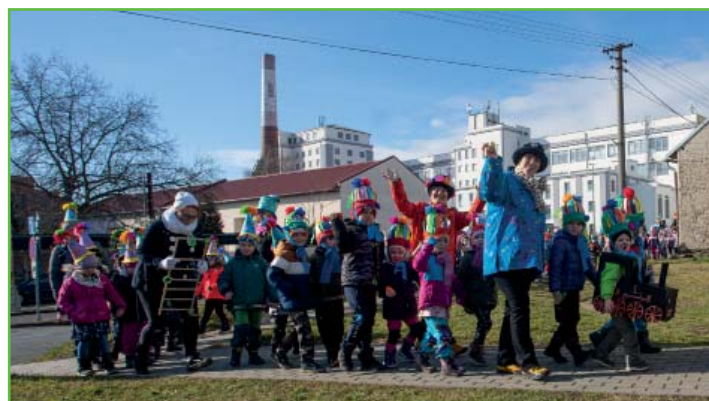
Masopustní průvod MŠ obcí