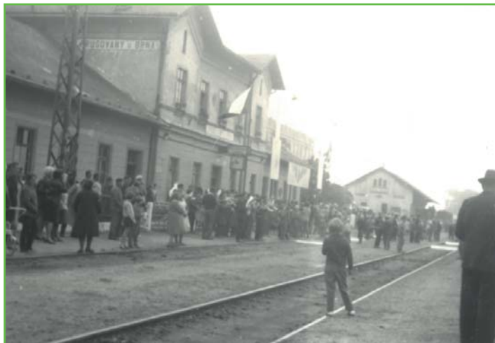
Hrušovanské nádraží při oslavě 130. výročí dráhy

Srovnajte si na fotografiích, jak vypadaly Hrušovany dříve a nyní: stejné místo, jiná doba. Pokud máte ke zveřejněným fotografiím jakékoli doplňující informace, komentář nebo pokud máte staré fotografie, o které byste byli ochotní se podělit, kontaktujte kronikářky na e-mailu kronika@ouhrusovany.cz nebo na telefonním čísle 725 772 774.