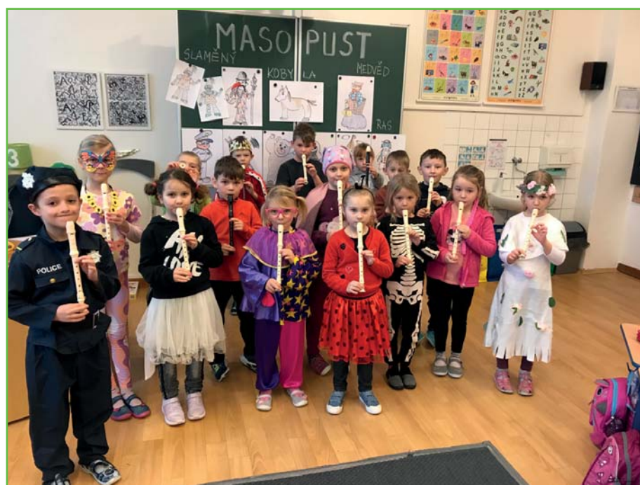
Masopust v 1.A

Něco z této tradice jsme si vyzkoušeli i my. Děti ve veselých kostýmech pozorně naslouchaly, aby se o masopustu dověděly co nejlépe. Společně jsme si zazpívali, zatancovali, zapískali na flétničky a obdivovali své masky. Teď už se všichni těšíme na jaro!