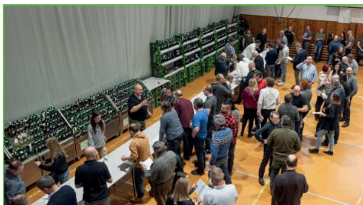
50. jubilejní výstava vín v hale na Jízdárenské