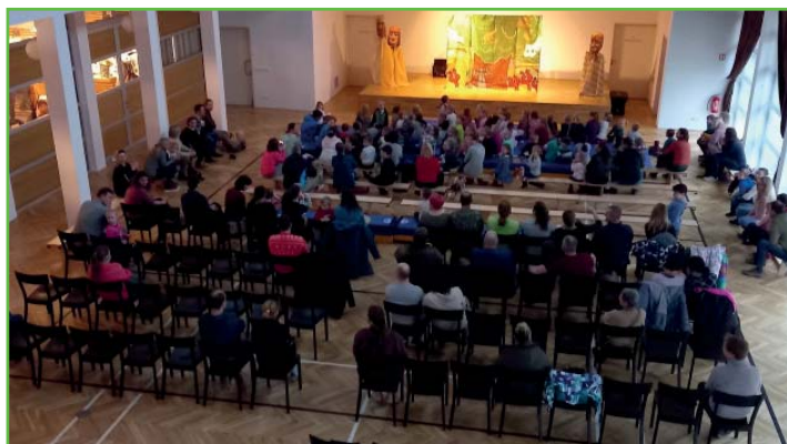
Divadelní představení Tříkrálová pohádka (Pavel Kadlec)