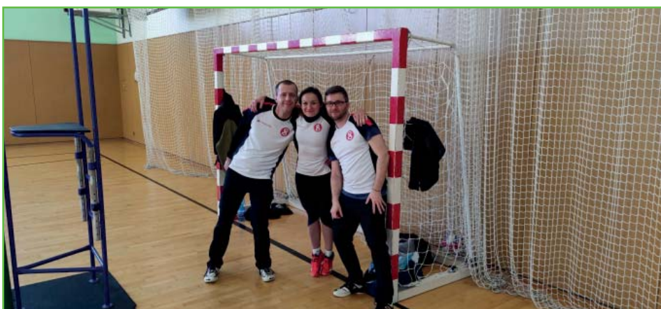
Trojice volejbalových trenérů na turnaji ve Střelcích