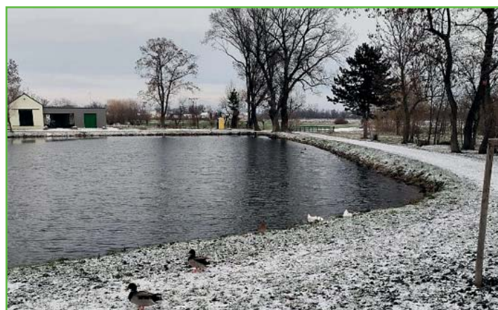
Leden na rybníku Vodárna