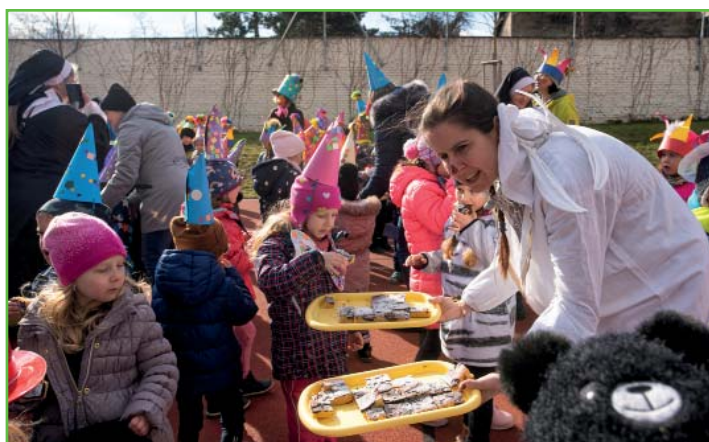
Zakončení masopustního průvodu na Sokecu